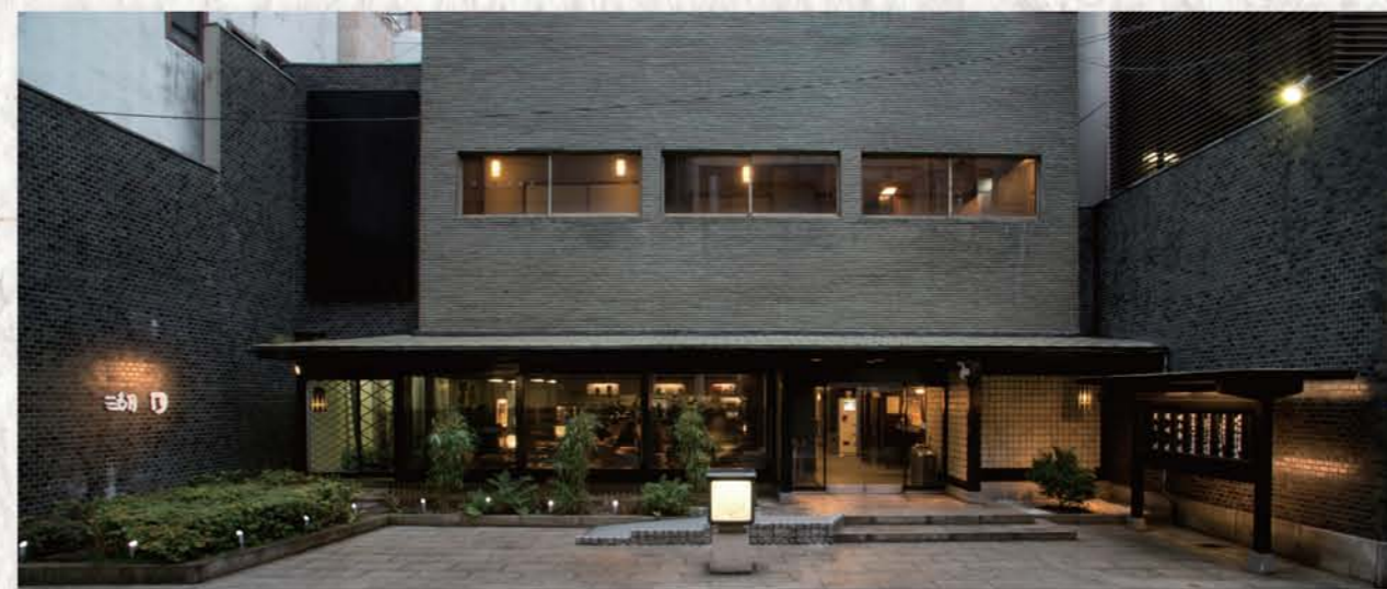
店舗北側外観(正面玄関側)